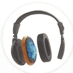
쿨링 게이밍 헤드셋 EarFridge®