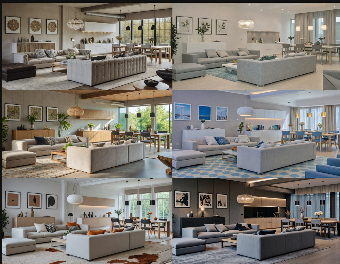
* 플랜바이 스튜디오 AI를 통해 생성된 이미지입니다.

플랜바이 스튜디오 는 인테리어 업체와 건설사를 위한 최첨단 AI 기반 인테리어 디자인 솔루션을 제공합니다. 저희의 목표는 혁신적인 기술로 업계의 수준을 한층 높이고, 고객에게 최상의 가치를 제공하는 것입니다.